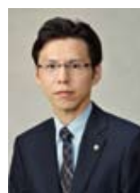
本多永享社会保険労務士事務所

今後一つでも多くの中小企業の組織体制が良好となり、時代の荒波を乗り越えて、更なる発展を遂げていくことを心より支援致しております。