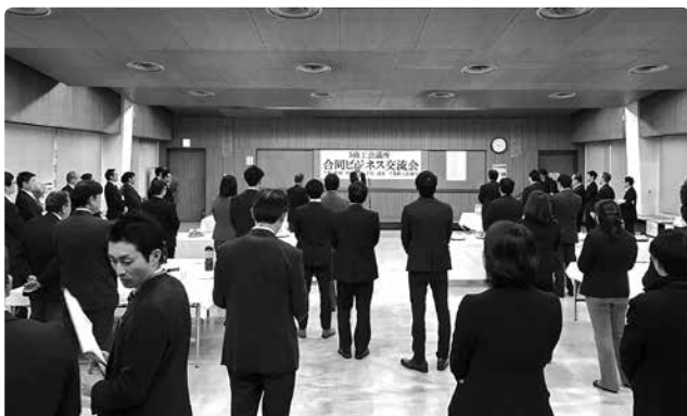
ネットワークの広がりを利用して交流を拡大

当日は、各会議所から全57事業所(内当所8事業所)が参加し、活発な商談や名刺交換を通じて、市域を越えた事業所間の交流が図られました。