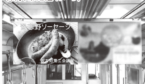
(車内中吊り広告イメージ)

毎月2,000部発行「商工習志野」へチラシ同封してPRしませんか? 1回につき31,500円 両面印刷・光沢・カラー印刷もOK! 36,000円で印刷(モノクロ)代行します!