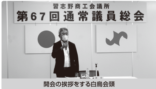
開会の挨拶をする白鳥会頭

6月23日(火)、第67回 通常議員総会を開催し、令和元年度事業や収支決算など、全7議案が承認されました。報告事項では、新型コロナウイルス感染症対策への対応や持続化給付金申請サポート会場について事務局より報告しました。